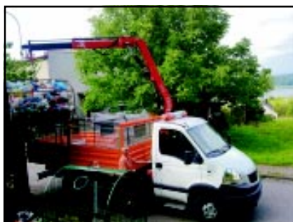
Samochód specjalistyczny ZUK Polanów