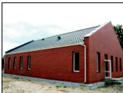
Świetlica wiejska w Kościernicy