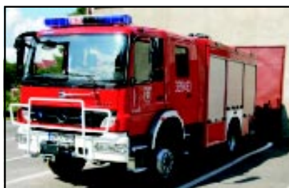
Nowo zakupiony samochód strażacki OSP Polanów

Dzięki zaangażowaniu władz lokalnych oraz możliwości pozyskania środków finansowych od instytucji europejskich, źródeł krajowych, zagranicznych, możliwy jest dalszy rozwój infrastruktury gminy oraz dalsza poprawa jakości życia mieszkańców gminy Polanów.