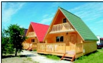
Ośrodek „Magnolia” w Łasinie Koszalińskim