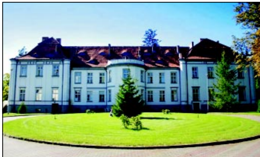
Pałac w Parsowie