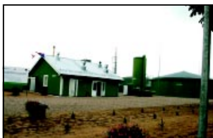
Poldanor biogazownia w Naclawiu