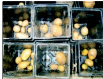
U góry mikrobulwy, niżej minibułwy