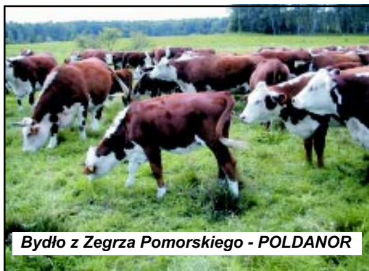
Bydło z Zegrza Pomorskiego - POLDANOR

Na terenie gminy działają dwa koła wędkarskie organizujące zawody przez cały rok. Poławianie ryb nie stanowi jedynej działalności kół. Wędkarze dbają także o czystość brzegów jezior i rzek oraz zajmują się zarybianiem akwenów.