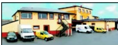
Piekarnia Bajgiel w Będzinie, która wypieka tegoroczny chleb dożynkowy