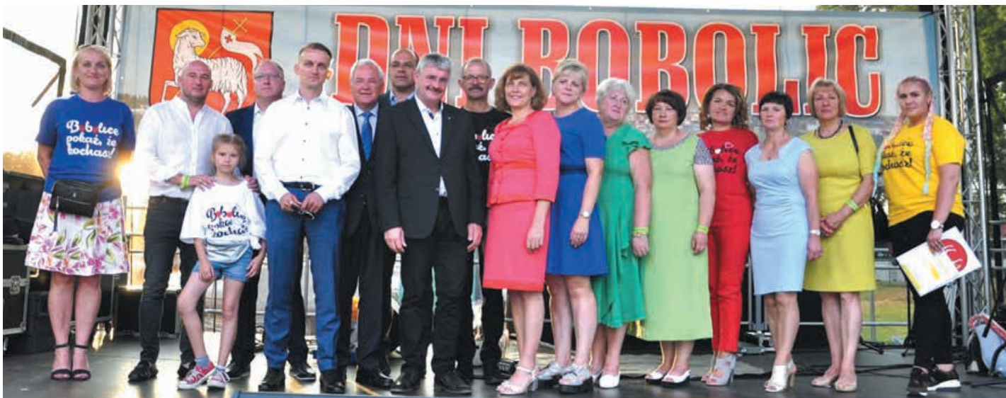
Podczas Dni Bobolic gościliśmy w Bobolicach delegacje z miast partnerskich z Demmina (Niemcy) oraz z Gminy Jaszuny (Litwa).