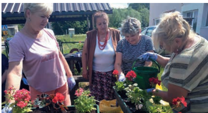
Warsztaty florystyczne - Głódowa