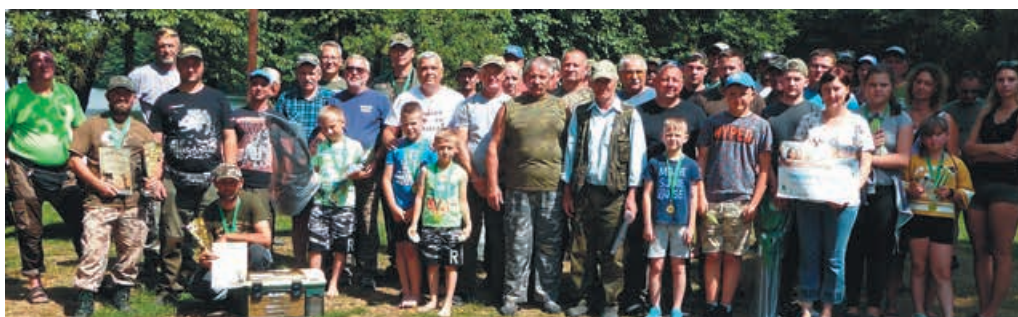
Uczestnicy Wędkarskiego Festynu Rodzinnego.