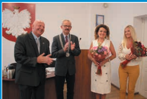
Z zaufaniem i jednomyślnie STR. 9