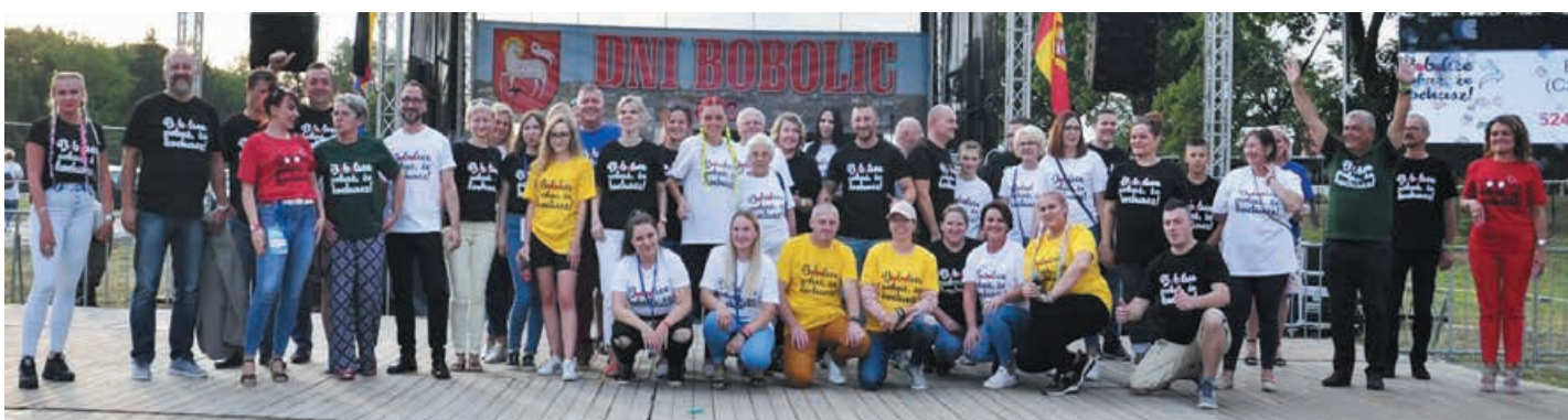
Podsumowanie konkursu Bobolice pokaż że kochasz.