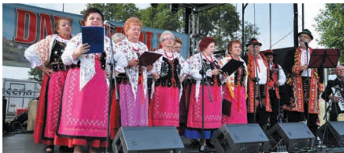
20 jubileusz istnienia świętowała na scenie kapela Ziemia Bobolicka.