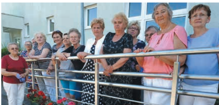
Warsztaty florystyczne w Bobolicach