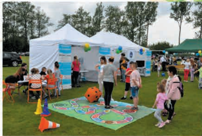
BIESIEKIERZ Gminny Dzień Dziecka, 01.06.2019 r.