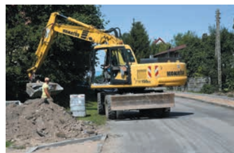
Prace na odcinku drogi w Dobrzycy.

W związku ze zbliżającym się końcem kadencji parlamentu ukazało się w druku sprawozdanie z działalności w Senacie RP, koszalińskiego senatora Piotra Zientarskiego. Publikujemy fragment poświęcony sprawom samorządowym.