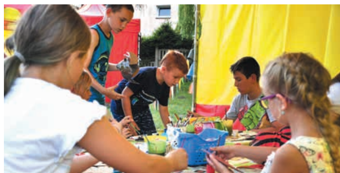
Dla rodzin magiczna wyspa przygotowała moc atrakcji.