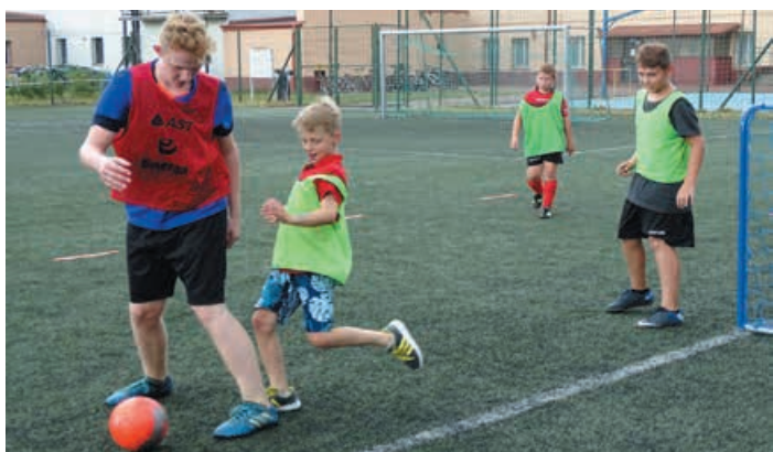
W niedzielę 21 lipca br. rozegrano XXII Turniej Piłki Nożnej CUP 2019