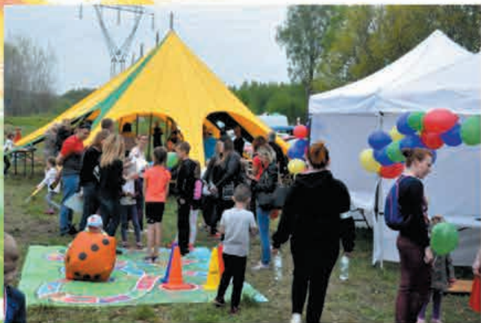
MANOWO , VI Bieg Wiosenny i Marsz Nordig Walking, 18.05.2019 r.

w ramach projektu pn. „ WIEM, BADAM SIĘ, ZAPOBIEGAM - badania dla mieszkańców powiatu koszalińskiego w kierunku wykrywania raka jelita grubego”