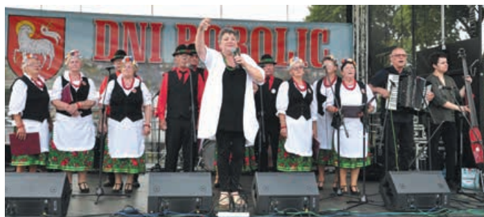
Na scenie „Świerzowianki” ze Świerzyńska.