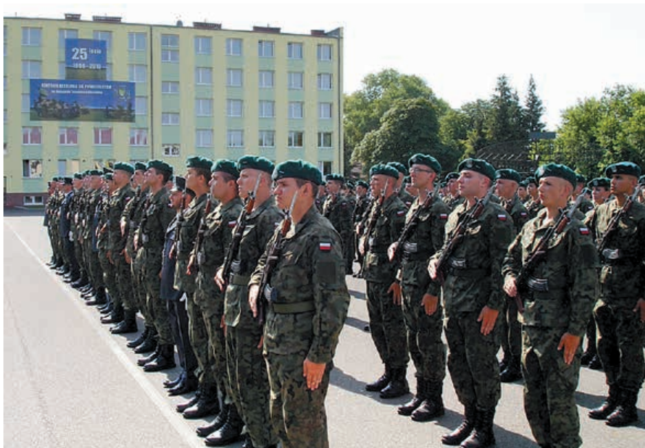
Lipcowa sobota w CSSP była podwójnym świętem w ośrodku koszalińskim z powodu przysięgi wojskowej ochotników z Legii Akademickiej.

Koszalińskie Centrum swoje święto obchodzi tradycyjnie 20 lipca. Powstało 25 lat temu na bazie Wyższej Szkoły Oficerskiej Wojsk Obrony Przeciwlotniczej, którą powołano w 1967 roku. Najpierw funkcjonowało jako Centrum Szkolenia Obrony Przeciwlotniczej. 1 października 2002 roku zmieniono nazwę na Centrum Szkolenia Wojsk Lotniczych i Obrony Powietrznej im. Romualda Traugutta. Nadto przejęto zadania realizowane wcześniej przez Centrum Szkolenia Radiotechnicznego w Jeleniej Górze. Powołanie Centrum było wynikiem restrukturyzacji i przebudowy Sił Zbrojnych i szkolnictwa woj-