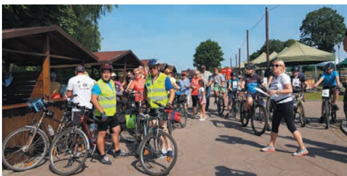
Bobolice promują zdrowy styl życia.