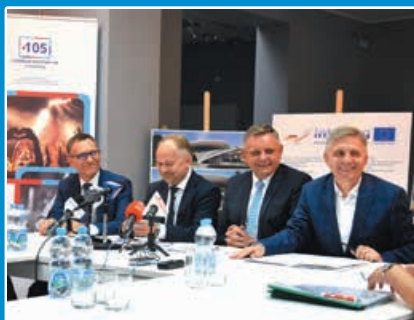
Amfiteatr do remontu STR. 17