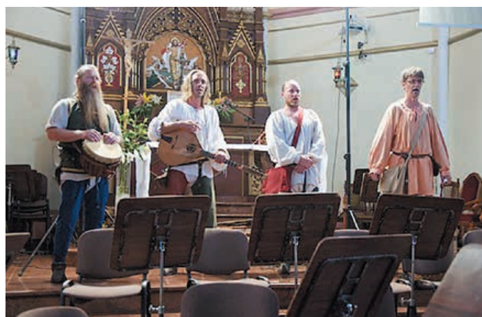
Podczas koncertu wystąpił zespół muzyki średniowiecznej z Czech „Remdih”.

Drużną część koncertu to Symfonia Organowa Saint – Saensa napisana w 1886 roku. W roku śmierci Liszta, a także w roku, w