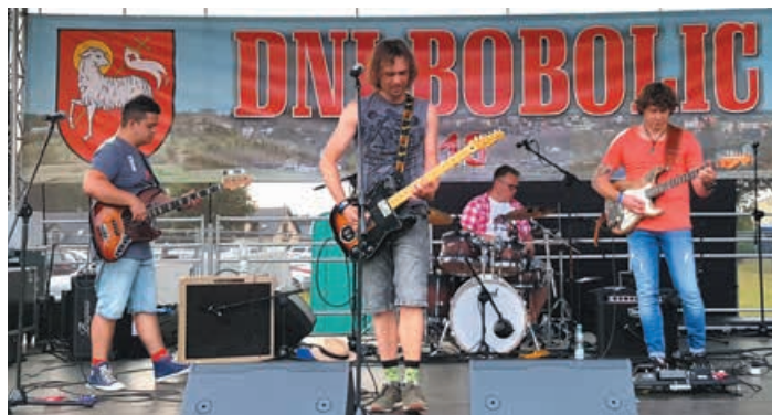
Nie zabrakło bobolickiego zespołu rockowego Tramp Key.