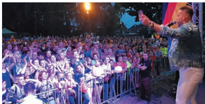
Tak się bawią Bobolice z Zespołem Extazy.