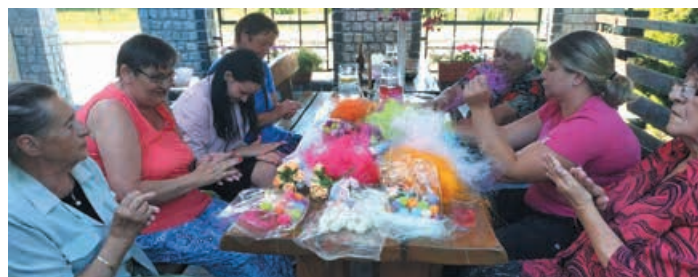
Warsztaty florystyczne - Drzewiany

Projekt dofinansowany ze środków Rządowego Programu na rzecz Aktywności Społecznej Osób Starszych na lata 2014-2020, ASOS - edycja 2019 r.