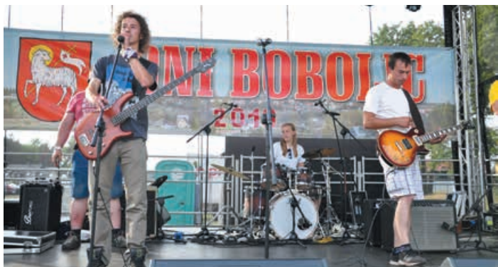
Zespół rockowy „Indygo” z Tychowa.