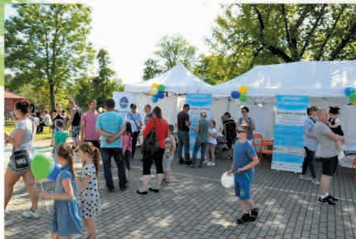
ŚWIESZYNO Gminny Dzień Dziecka, 02.06.2019 r.