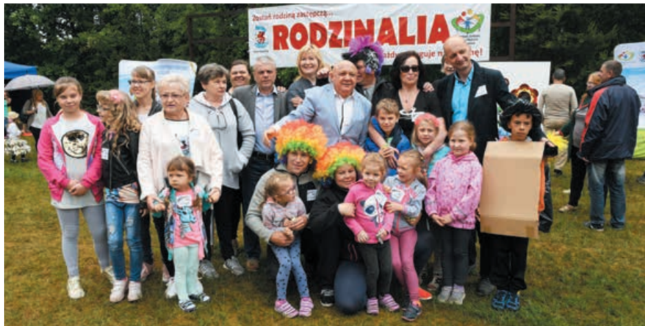
Senator Piotr Zientarski na jednej z imprez samorządowych poświęconych rodzinom zastępczym, organizowanej przez powiat koszaliński.