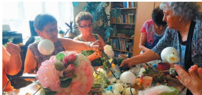
Warsztaty florystyczne - Porost