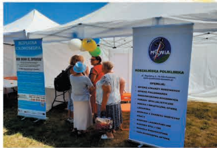
MIELNO, Unieście Familiada, 22.06.2019 r.