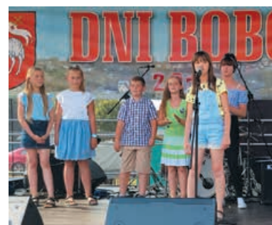
Występy artystyczne dzieci i młodzieży.