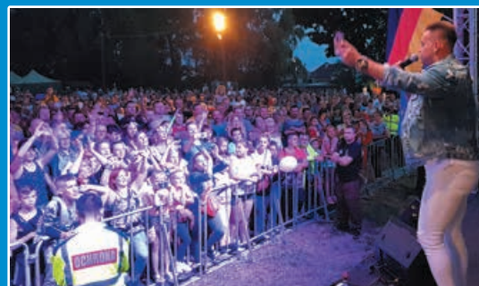
Dni Bobolic 2019 – fotoreportaż STR. 22-23