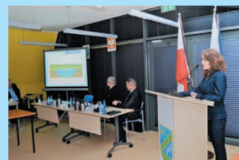
Ocenili stan Jamna