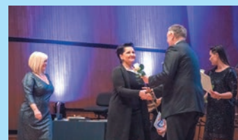
X Gala Koszalińskiej Kultury