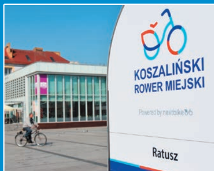
Koszaliński Rower Miejski STR. 7