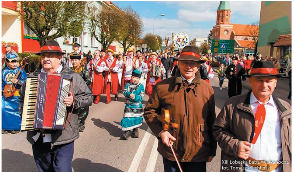
XIII Łobeska Baba Wielkanocna

W tym roku zaprezentowały się zespoły pieśni i tańca, kapele, zespoły śpiewacze i soliści z Ukrainy, Białorusi, Niemiec, Polski, Rosji... W tym doborowym towarzystwie najlepszym wykonawcą i zdobywcą Grand Prix w kategorii kapel ludowych została kapela „SWATY” z GOK Będzino. Gratulujemy!