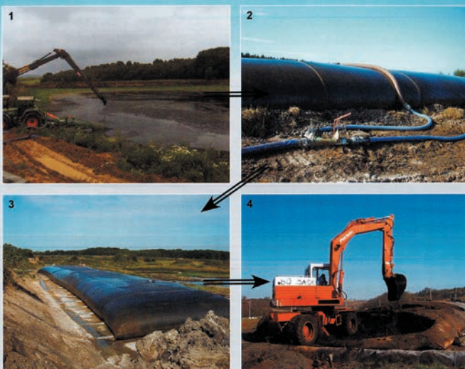
Poszczególne etapy odprowadzania osadów w stanie płynnym