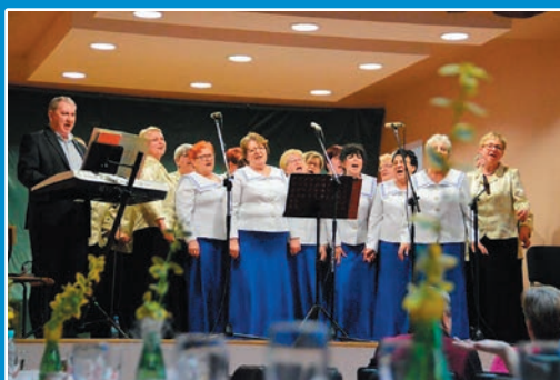
Wieczór z muzyką w Świeszynie STR. 15