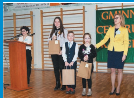
Targi edukacyjno-zawodowe w Bobolicach STR. 17