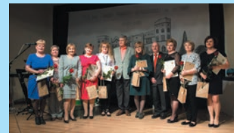
Jubileusz Domu Pomocy Społecznej w Cetuniu