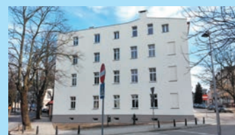
Klucze do mieszkań