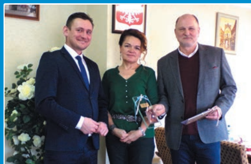
Pęrla dla „Mlekosza” STR. 9