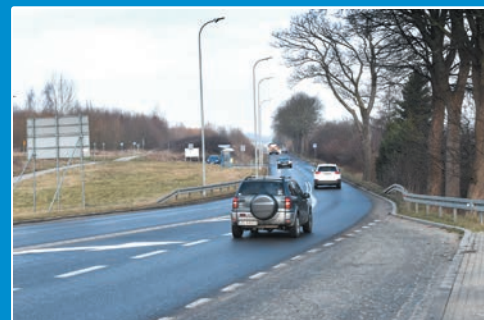
Nowa ulica Władysława IV w Koszalinie STR. 10