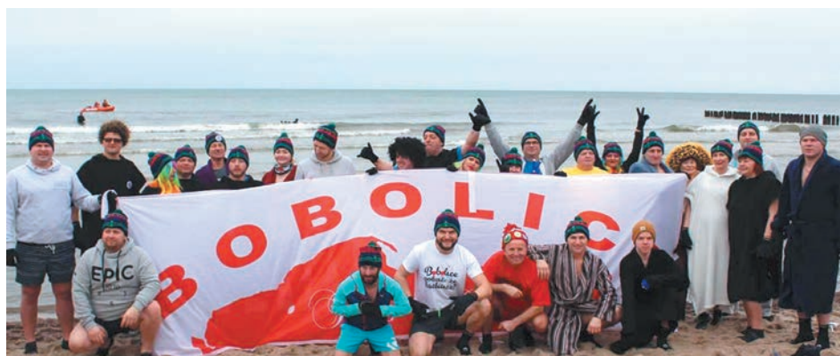
W mieleńskim Złocie Morsów wzięła udział także liczna grupa bobolickich Morsjan.

Mielno po raz kolejny pokazało, że chce to móc i powoli przygotowuje się do kolejnego Złotu. Za rok będziemy bawić się już po raz siedemnasty. Termin Złotu przypada tradycyjnie na drugi weekend lutego (7-9.02.2020), a rejestracja ruszy w listopadzie. Już teraz możecie planować udział w tym wyjątkowym wydarzeniu!