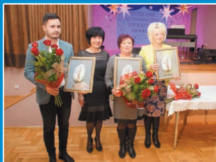
Świeszyńskie Platany 2018 rozdane! STR. 5