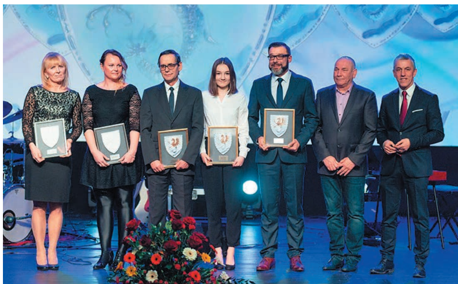
Laureaci „Rybogryfów 2018” w kategorii sportowej na scenie kina Zorza.