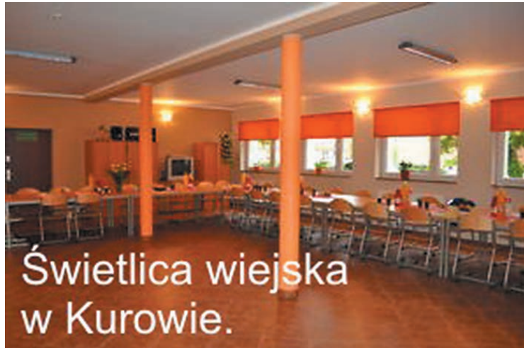
Świetlica wiejska w Kurowie.