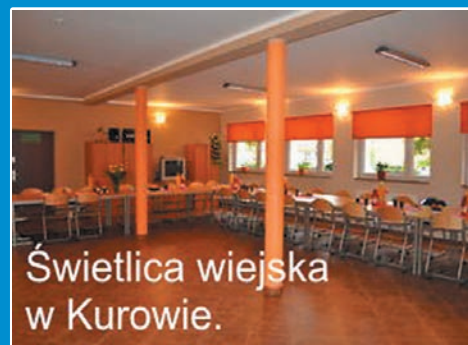
Świetlica wiejska w Kurowie.