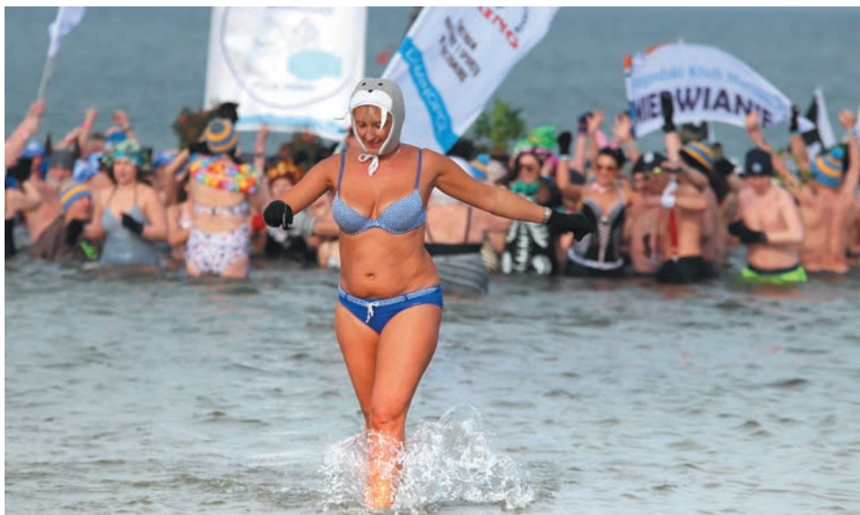
Morsujący panowie nazywani są Morsami, panie z kolei - Foczkami