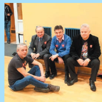
Strażacy pod siatką