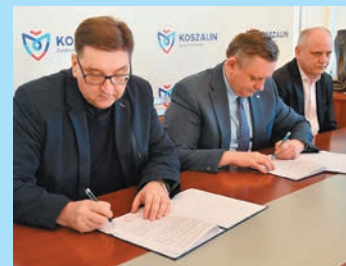
Remont katedry i renowacja organów