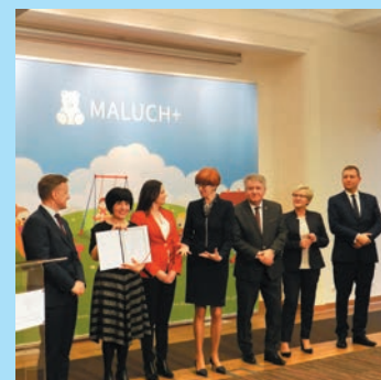
Powstanie placówka dla maluchów w Konikowie