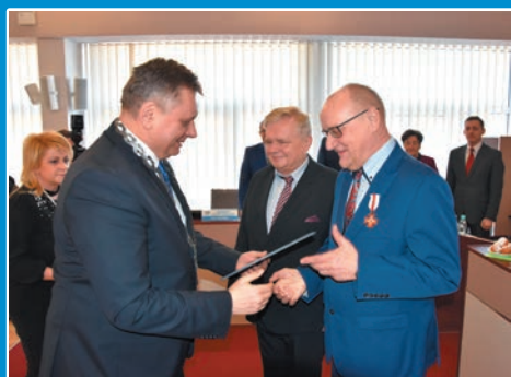
Pożegnania dyrektorów STR. 4