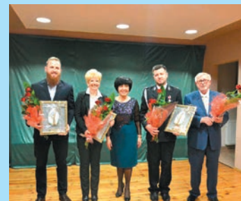
Spotkanie noworoczne w Świeszynie