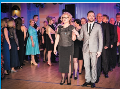
Charytatywny bal w Mielnie STR. 6