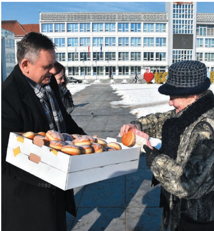
Koszaliński „tłusty czwartek”