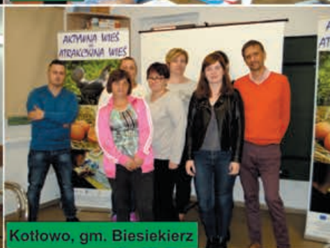
Kotłowo, gm. Biesiekierz