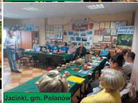
Jacinki, gm. Polanów