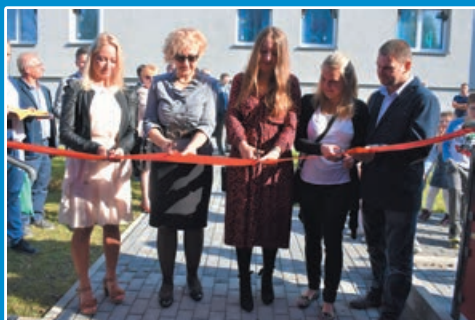
Z myślą o mieszkańcach – tych małych i tych dużych STR. 5