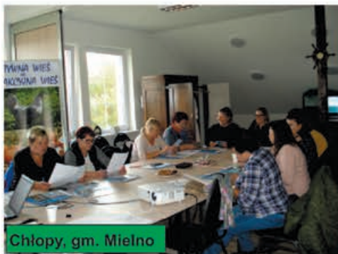
Chłopy, gm. Mielno

CYKL BEZPŁATNYCH SZKOLEŃ NA TERENIE POWIATU KOSZALIŃSKIEGO