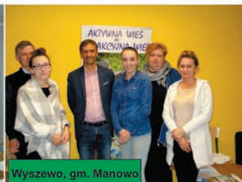
Wyszewo, gm. Manowo