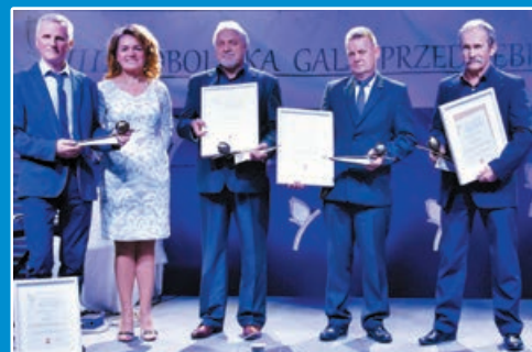
VIII Bobolicka Gala Przedsiębiorczości STR. 12