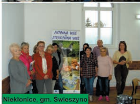
Niekłonicze, gm. Świeszyno