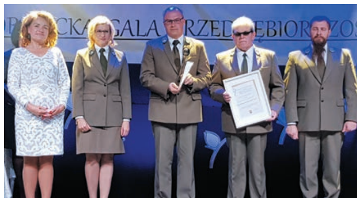
„Pąk” dla Nadleśnictwa Bobolice.