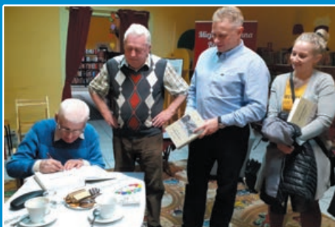
Spotkanie autorskie z Bronisławem Malinowskim STR. 7