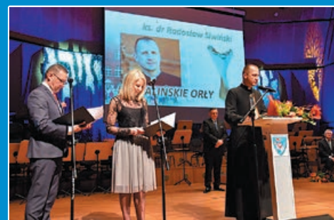
Koszalińskie orły wylądowały STR. 20 – 22