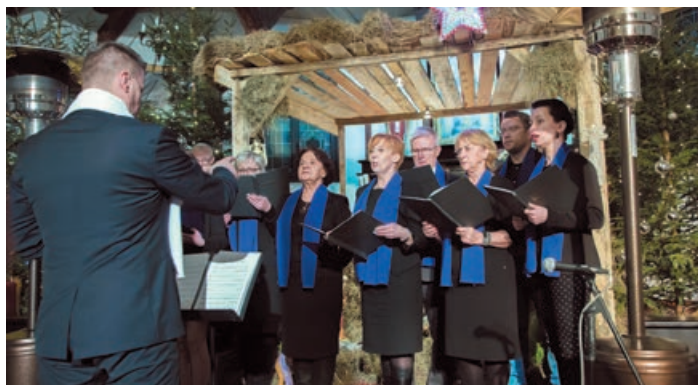
23 stycznia w Żydowie odbył się III Przegląd Kolęd i Pastoralek