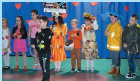
Tak grała orkiestra