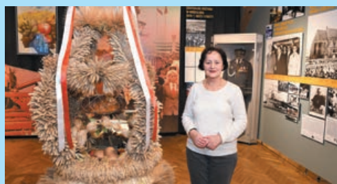
Podróż przez dekady pełna wrażeń