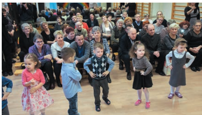
26 stycznia w Przedszkolu Gminnym w Polanowie obchodzono Dzień Babci i Dziadka