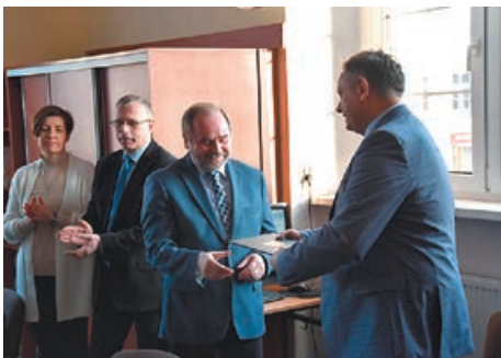
Na zdjęciu: prezydent Piotr Jedliński składa gratulacje w I LO