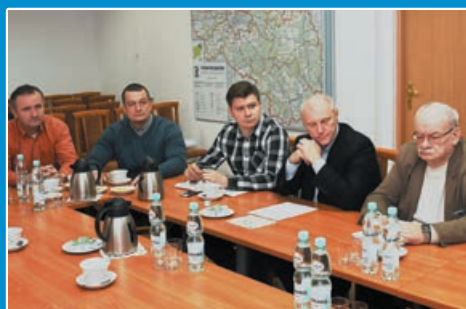
Powiat walczy o swoje drogi STR. 6