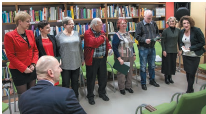
25 stycznia Teatr przy stoliku przygotował montaż poetycki poświęcony poezji Leśmiana