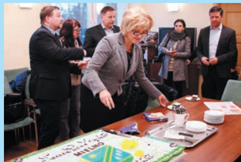
Mielno pod nowym Szyldem