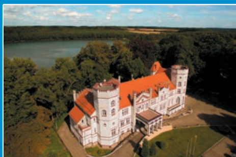
Starosta o planach inwestycyjnych w 2017 STR. 9