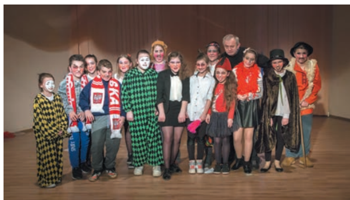
W dniach 7-10 lutego odbywały się warsztaty teatralne POLANOWSKIE GRANIE