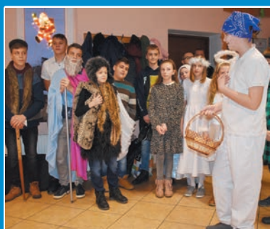
WOŚP po raz 28. STR. 4