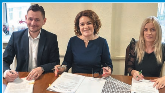
Rusza budowa drogi do strefy inwestycyjnej w Bobolicach STR. 15