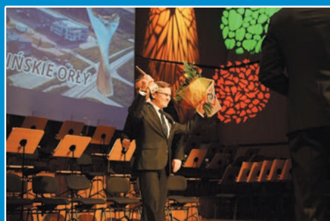
Koszalińskie Orły wylądowały STR. 6