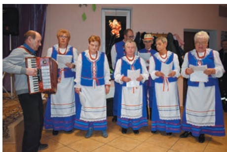
Występ Kapeli „Florianki” w świetlicy w Kłaninie.

Bobolicki Morsjanie na rzecz WOŚP zebrali 7.000,01 gr.