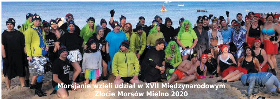
Morsjanie wzięli udział w XVII Międzynarodowym Zlocie Morsów Mielno 2020