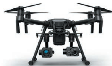
Dron z kamerą termowizyjną oraz kamerą przekazującą obraz w czasie rzeczywistym w trakcie lotu

W najbliższym czasie OSP ma w planie realizację trzeciej i najważniejszej części zakupów jaką jest samochód ratowniczo-gaśniczy. Dostawca wozu wyłoniony w drugim przetargu wyprodukuje dla tej jednostki pojazd na podwoziu SCANIA, model P360, wersja 4x4. Najważniejszą funkcją samochodu jest innowacyjny system gaszenia suchą pianą.