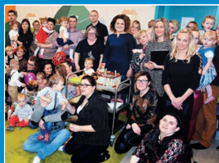
Roczek Żłobka Miejskiego ELFIKI w Bobolicach STR. 16