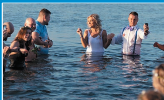
17. Złot Morsów w Mielnie STR. 2-3