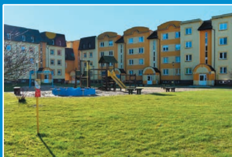
Program „ładne podwórko” STR. 11