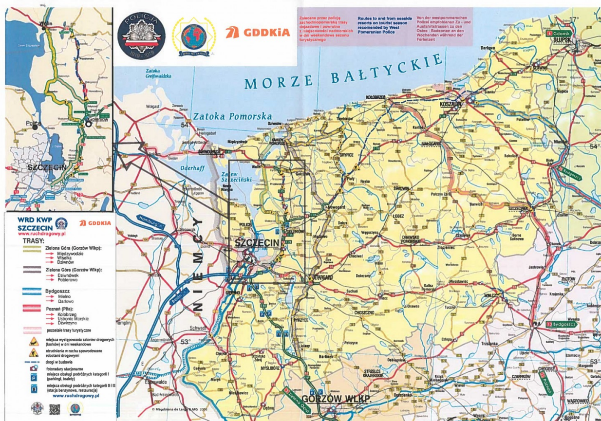
Mapa - Trasy alternatywne